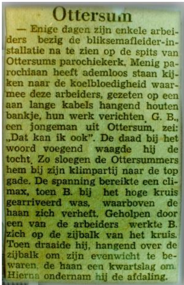
Krantenartikel in de Gelderlander, midden jaren vijftig.

Aan het einde van de Tweede Wereldoorlog gebruikten de Duitsers veel kerktorens als uitkijkpost. Zo konden ze over de Maas de geallieerden stellingen zien liggen en hun verrichtingen bekijken. Helemaal boven in de toren timmerden de Duitsers een stoel vast (die nog steeds te zien is!) aan het gebint zodat daar een Duitser op kon zitten om de overkant in de gaten te houden. De geallieerden wisten dit en schoten vanuit de Brabantse kant nogal wat torens in puin, zodat ze die niet meer als uitkijktoren konden gebruiken. Toen de Ottersummers in mei/juni 1945 van de evacuatie terugkeerden in hun geliefde dorpje stond de hoge toren nog fier overeind.